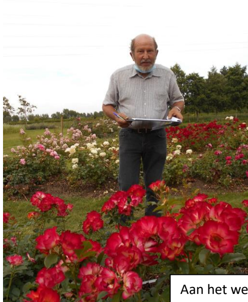
Aan het werk in het PCS Destelbergen