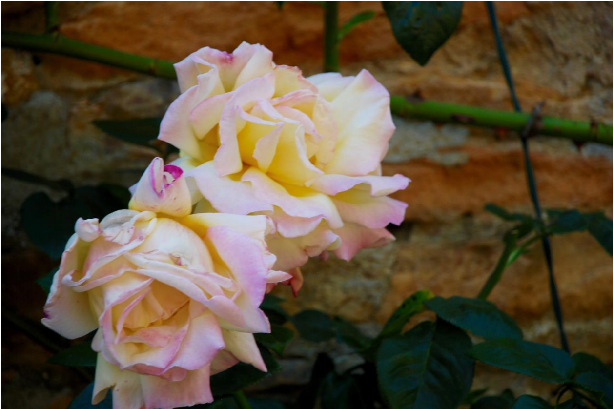
Peace in de Jardins de Bionnay (WFRS 2015)