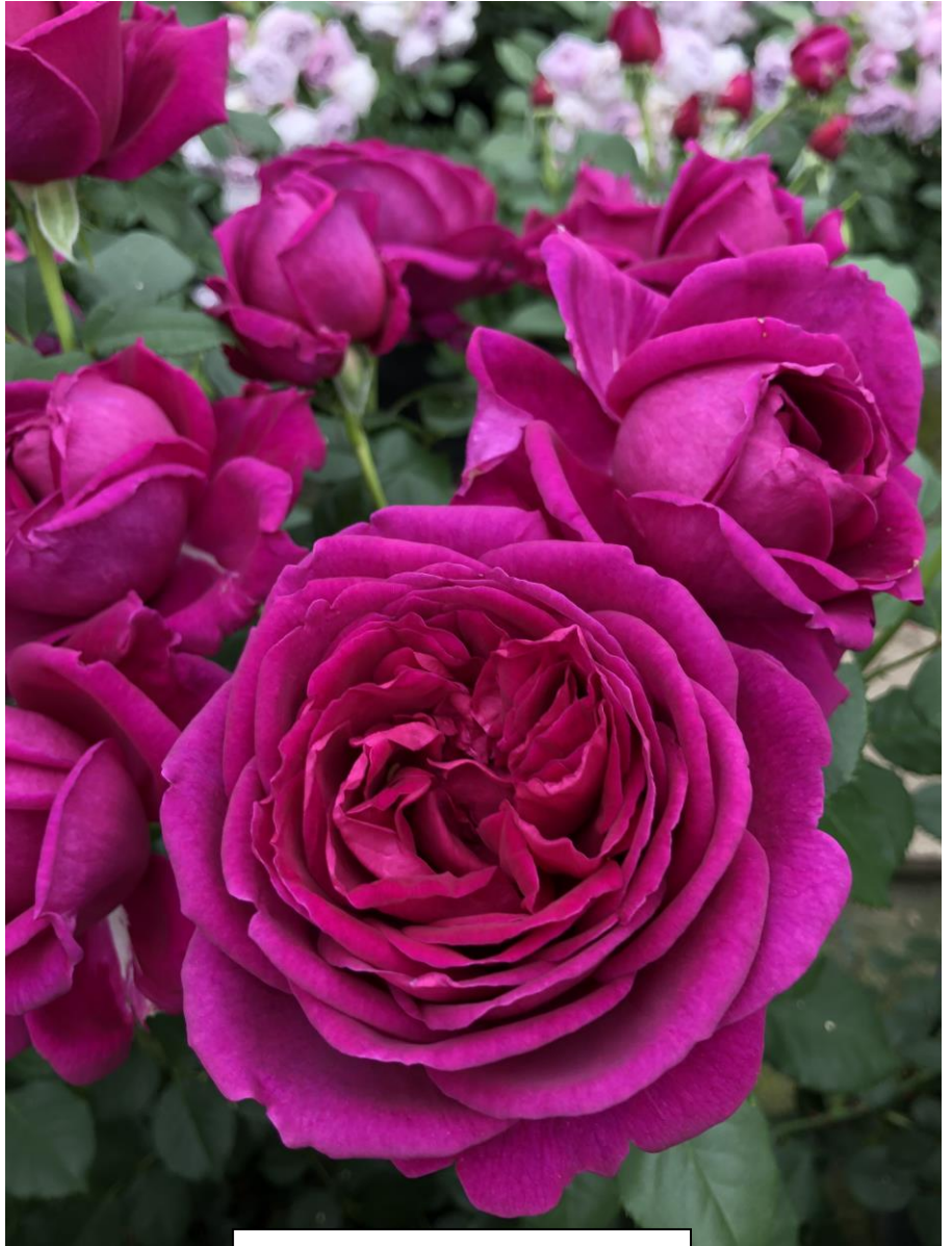
Für Elise